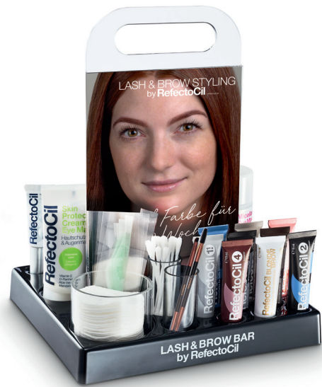
PRÉSENTOIR DE COMPTOIR